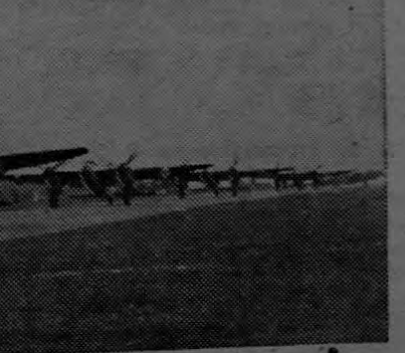
En la foto puede apreciarse una formación de caza-bombarderos "Mosquito" listos para despegar rumbo a la capital germana.

London Financial News". La fábrica en referencia ocupa una área total de 375.000 metros cuadrados y emplea mil obreros. Anteriormente era administrada por el Gobierno Canadiense y se ha dedicado (Pasa a la pág. CUATRO)