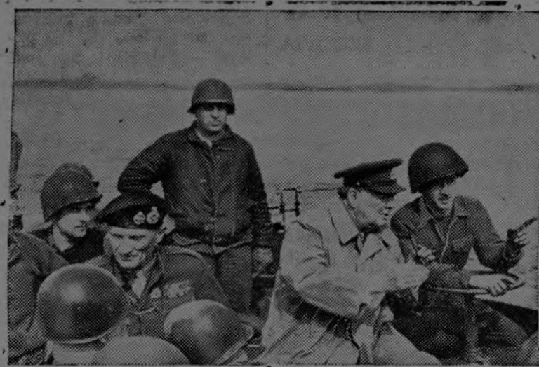
En una lancha de asalto norte-americana, el Primer Ministro Churchill y el Mariscal Montgomery cruzan el Rin.