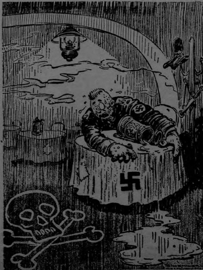
VISIONES EN LA CERVECERIA DE MUNICH

EN EL PASAJE AMERLING ESPECIALIDAD EN ARTICULOS DE PUNTO TELEFONO 4176 SAN JOSE APARTADO 390