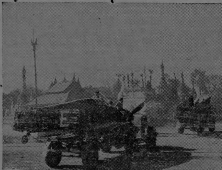
Un convoy británico de salvamento para las naves y tripulaciones aéreas pasa por entre una villa birmana abandonada para ir en auxilio de un aparato Hurricane que estrelló en la selva.

J. Fernando Barrientos Agosto 4 de 1945.