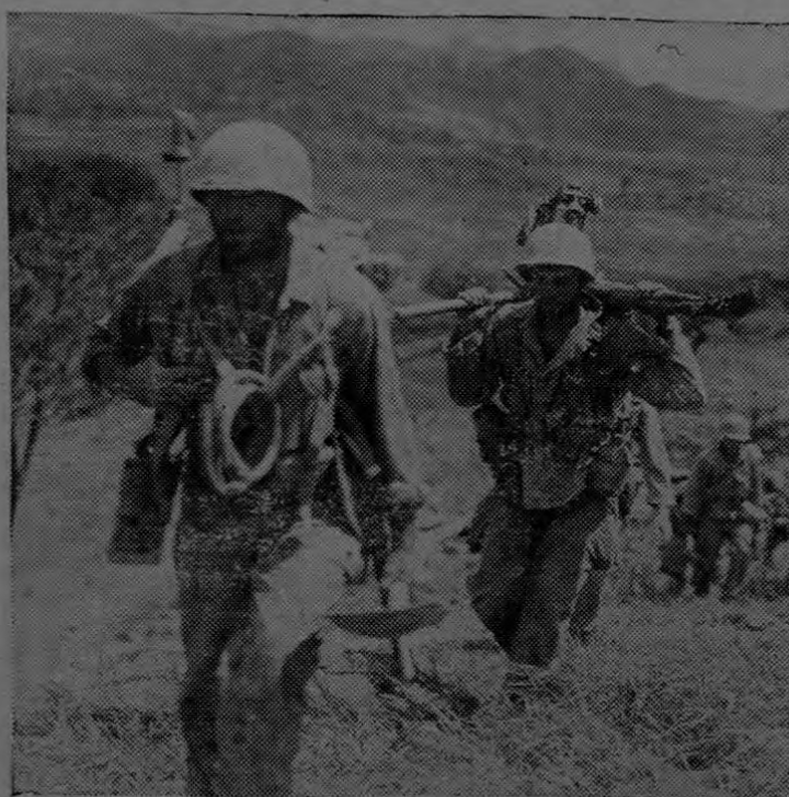
Soldados de los Estados Unidos, portadores de pesado armamento, macilentos y con la barba crecida, avanzan en Okinawa llevando ametralladoras de grande y pequeño calibre para apoyar con su fuego los asaltos de la infantería contra las posiciones japonesas.

TALLER Mecánico Eléctrico de OSCAR THOMPSON Ofrece: Herrería en todo su ramo. Reparación de Co- cinas, Motores, Dinamos, Transformadores, etc. 225 vs. Sur de Catedral