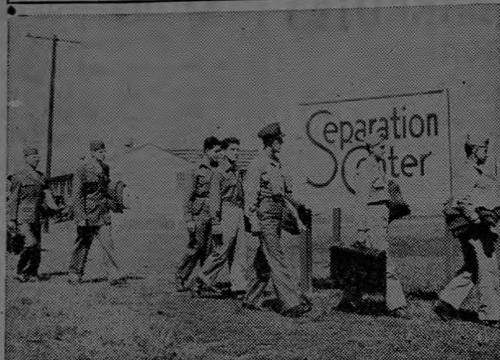
Un grupo de soldados con derecho al licenciamiento, llega a un centro militar de los Estados Unidos después de largos servicios en ultramar.

WASHINGTON.—Para la guerra contra el Eje los Estados Unidos levantaron un ejército de 12.000.000 de hombres y al terminar la campaña de Europa el gobierno comenzó a poner en práctica un plan para retornar a sus familias el mayor número de reclutas posible con toda la rapidez que permitan las circunstancias.